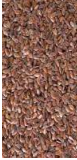
شكل (1) : بذور الكتان

تحتوي بذور الكتان البنية اللون على 41 ٪ من الدهون، 28٪ بروتين و 4٪ معادن كالسيوم والحديد والزنك والكالسيوم واليوتاسيوم والمغنيسيوم وحمض الفوليك (3) من المعروف أن بذور الكتان هي مصدر لمحتوى عالي من الأحماض الدهنية المتعددة غير المشبعة إذ يكون الزيت فيها حوالي 40 ٪ من أوميغا 3 التي تقيد في خفض مستويات الكوليسترول. كما انها تحتوي على نسبة 98٪ من مادة lignans المضادة للسرطان و97٪ من الألياف الغذائية (جدول 1)، وتعتبر هذه المواد ذات فائدة في انقاص الوزن ولمرض السكر كما تعالج أمراض الكبد. حيث أصبحت بذور الكتان معروفة بأنها غذاء وظيفي بسبب تركيبها الغذائية، والتي لها آثار إيجابية على الوقاية من الأمراض وتوفير مكونات مفيدة للصحة [4].