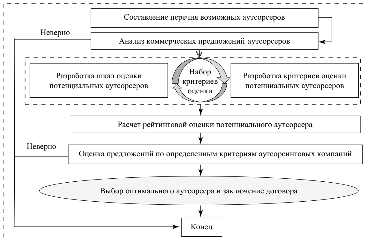
Рис. 3. Модель выбора оптимального аутсорсера