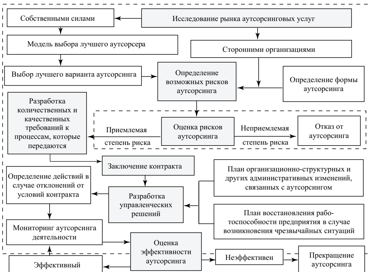
Рис. 2. Процесс реализации механизма управления аутсорсингом на предприятии [The process of implementing the management mechanism of outsourcing in the enterprise]