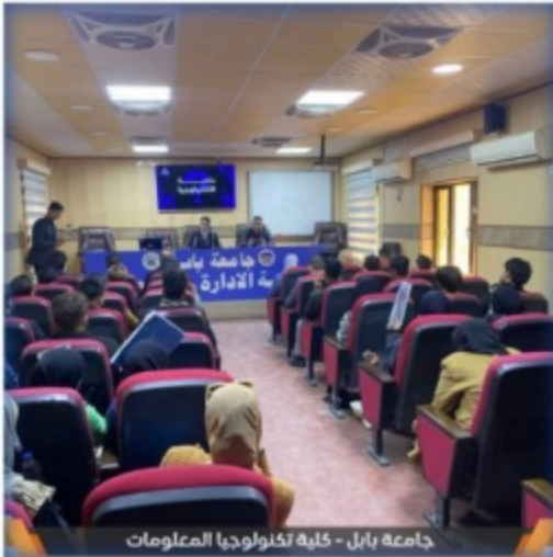
جامعة بابل - كلية تكنولوجيا المعلومات

تناولت الورشة التحولات التي يشهدها الاقتصاد بسبب التطور التكنولوجي السريع حيث تم التطرق إلى مواضيع مهمة مثل دور الذكاء الاصطناعي في تغيير طبيعة الوظائف وتأثير الأتمتة و الروبوتات على الإنتاجية وسوق العمل.