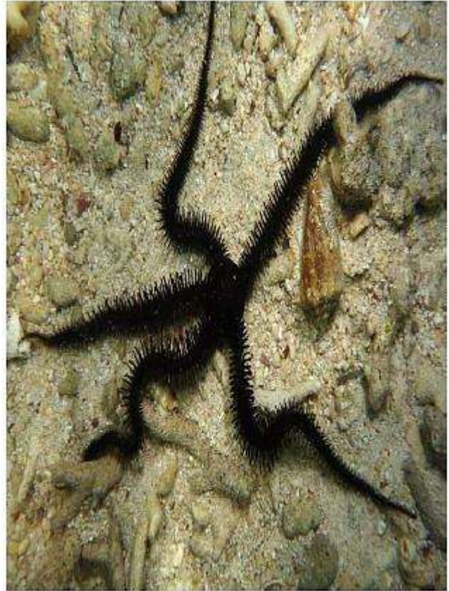
نجم البحر الهش