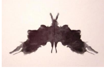
شكل (٢) حبر الأسود والرمادي، الخفافيش، فراشة، البطاقة الخامسة من اختبار رورشاخ

وهناك كثير من العلماء استعان بالظاهرة في الدراسات النفسية مثال اختبارات هيرمان رورشاخ* (انظر شكل ٢)، وهنا من مكن أن ينظر إلى مجموعة بسيطة من الخطوط ودوائر بسرعة على أنها وجه، وحتى يمكن تفسيرها على أنها تعبر عن عاطفة معينة (انظر شكل ٣)