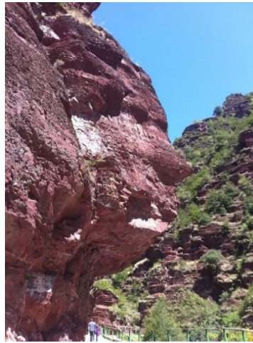
شكل (١) (وجه الإنسان المجهد) من الصخر الأحمر (حديقة ميركانتور الوطنية، فرنسا)

ان تعبيرات الوجوه قد تعطي معنى اشمل واسرع للمشاعر والانفعالات من التعبير اللفظي المباشر، كما أشار القرآن الكريم في آيات كثيرة عن تعبيرات الوجوه مثلا لعبوس كقوله تعالى "عبس وتولى . عبس، آية ١" وايضا السعادة قوله تعالى "وجوه يومئذ مسفرة ضاحكة مستبشرة . عبس الآيات ٣٨، ٣٩"، لاستكبار قوله تعالى "ولا تصعر خدك للناس..... لقمان، آية ١٨" وآيات كريمة اخرى عديدة تصف المشاعر الانسانية من خلال تعبيرات الوجوه ٩ (الحسين، ٢٠١٧)