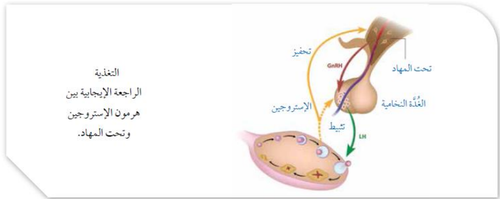
شكل (2-2) يوضح نظام التغذية الراجعة الإيجابية

كذلك هرمون الاستروجين و LH يعمل بنظام التغذية الراجعة الإيجابية